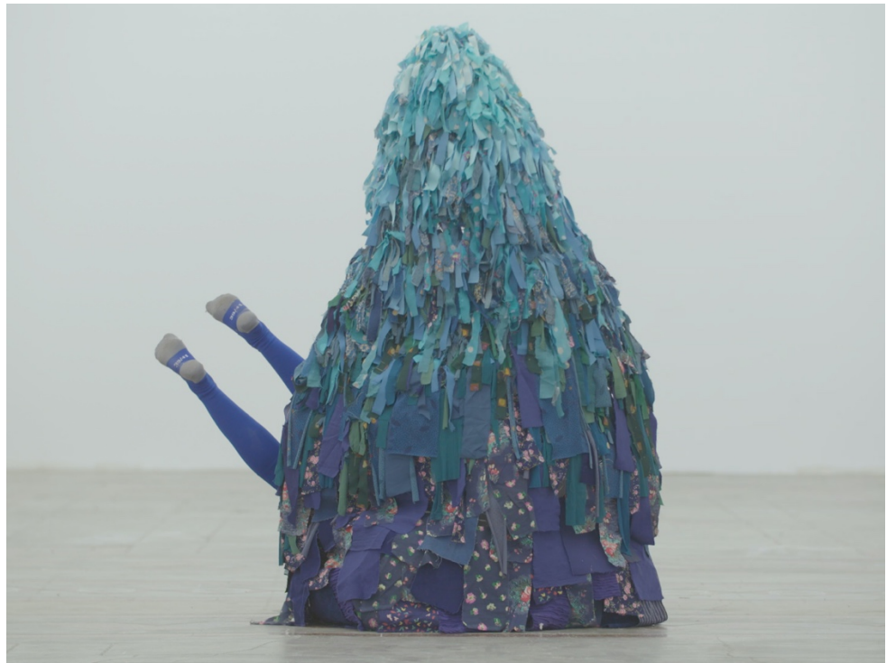
© installation Émilie Faïf plasticienne